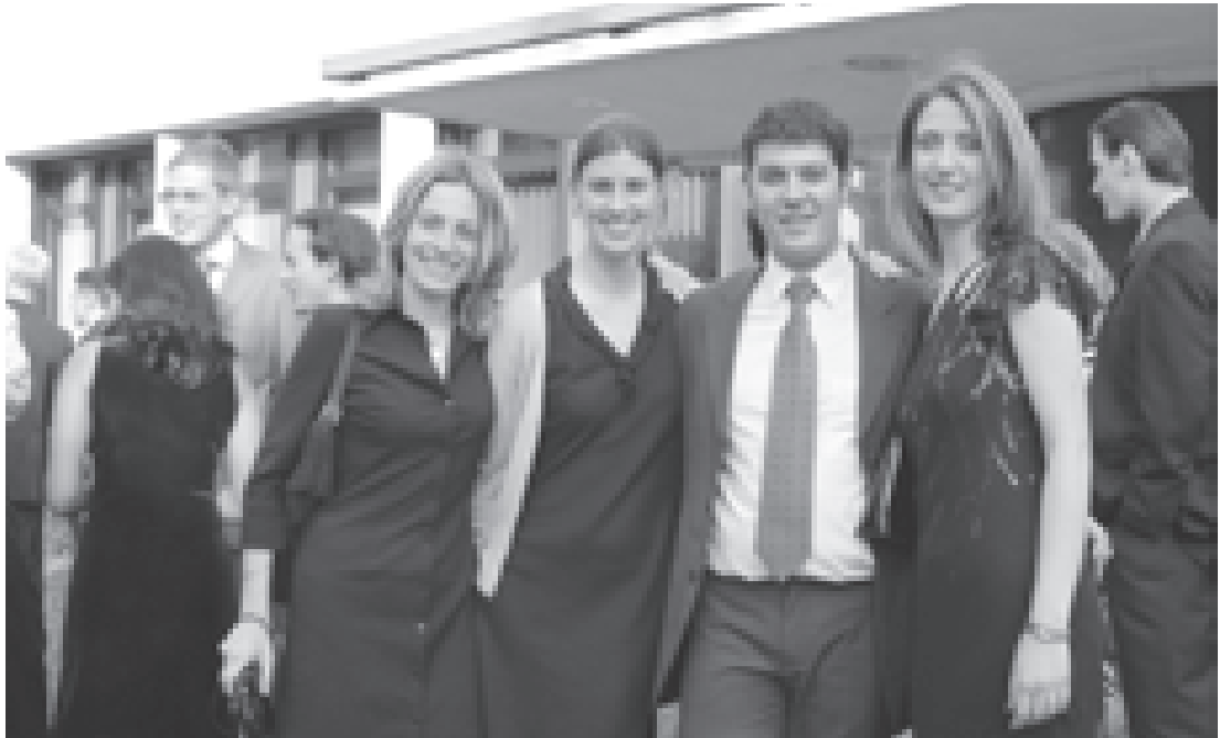
Freude bei den Fellows des Jahrgangs 2002/2003: Sie haben ihren „Master of European Studies“ in der Tasche.

Über 100 Studenten haben inzwischen den 1998 gegründeten postgradualen Vollzeit-Studiengang „Master of European Studies“ am ZEI erfolgreich abgeschlossen. Die gleich bleibend hohe Zahl von jährlich 130 bis 160 Bewerbungen aus aller Welt zeigt, dass sich das Programm längst über die Grenzen Deutschlands hinaus einen Namen gemacht hat. Sein