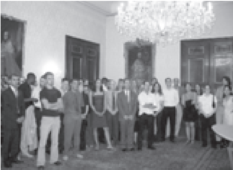
Feierliche Eröffnung der Sommeruniversität mit Experten aus Israel und den palästinensischen Gebieten: Empfang im Alten Rathaus in Bonn