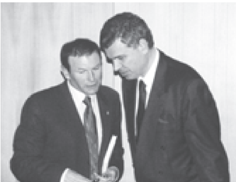
Juan José Ibarretxe, Ministerpräsident des Baskenlands, sprach am 26. März 2003 am ZEI über die Rolle dieser autonomen Region in einer globalisierten Welt. Er forderte das Recht, in den Gremien der EU angemessen repräsentiert zu sein. Er sehe die europäische Zukunft als eine Zukunft der Regionen im Rahmen der EU, die die Nationalstaaten überflüssig mache.

Der Mittelmeerraum hat nach dem Ende des Ost-West-Konflikts eine zunehmend stärkere Aufmerksamkeit in der transatlantischen Sicherheitspolitik erfahren. Ethnische Konflikte, Terrorismus, Proliferation von Massenvernichtungswaffen und Bürgerkriegsflüchtlinge sind sicherheitspolitische Bedrohungen und Risiken, welche die südliche Peripherie der EU zu einem der neuen Krisen- und Konflikt-herde für die Sicherheit Europas haben werden lassen. Aus der Sicht vieler Beobachter auf beiden Seiten des Atlantiks ist nur die NATO in der Lage, für Sicherheit und Stabilität in dieser Region zu sorgen. Die NATO hat sich bereits frühzeitig dieser Herausforderung angenommen, doch treten bei der Entwicklung einer Mittelmeerpolitik der Allianz zahlreiche Probleme und Friktionen zu Tage. Wie sich dieser Widerspruch erklären lässt, ist eine der zentralen Fragestellungen, denen Carlo Masala, Senior Fellow am ZEI, in seiner Studie „ Den Blick nach Süden? Die NATO im Mittelmeerraum (1990–2003). Fallstudie zur Anpassung militärischer Allianzen an neue sicherheitspolitische Rahmenbedingungen “, erschienen als Band 57 der ZEI-Schriftenreihe, nachgeht.