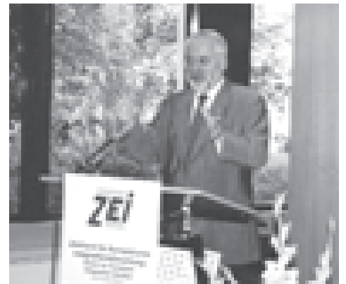
ZEI-Europaforum am 15. Juli 2003: Dr. Erhard Busek spricht über „Die sicherheitspolitische Situation in Südosteuropa“

„The Future of the Euro-Mediterranean Relations – The Vision of Malta“ Prof. Guido de Marco, Präsident der Republik Malta