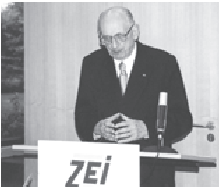
ZEI-Europaforum am 9. Oktober 2003: Der ehemalige polnische Außenminister Władysław Bartoszewski (Mitglied des Internationalen Beirats des ZEI) spricht über „Europas Identität nach der Osterweiterung der EU“